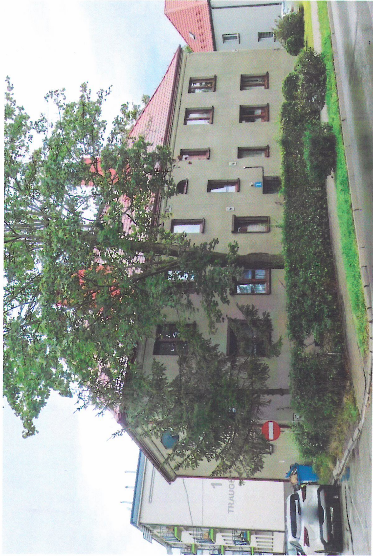
Widok budynku od północnego-wschodu

7. Fotografia z opisem wskazującym orientację w stosunku do sąsiednich terenów lub stron świata albo mapa z zaznaczonym stanowiskiem archeologicznym