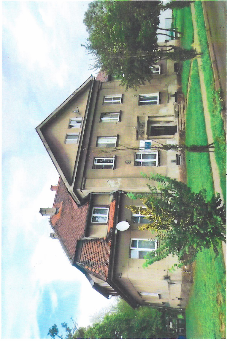
Widok budynku od południowego-zachodu

7. Fotografia z opisem wskazującym orientację w stosunku do sąsiednich terenów lub stron świata albo mapa z zaznaczonym stanowiskiem archeologicznym