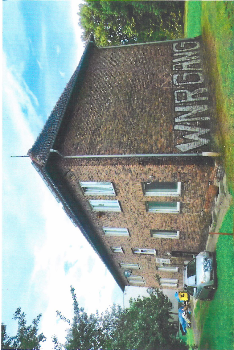
Widok budynku od południowego-wschodu

7. Fotografia z opisem wskazującym orientację w stosunku do sąsiednich terenów lub stron świata albo mapa z zaznaczonym stanowiskiem archeologicznym