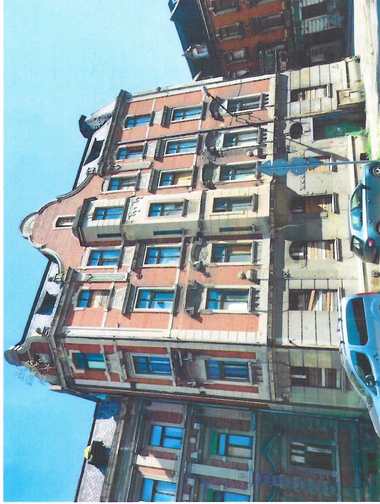
Widok budynku od południowego-zachodu

7. Fotografia z opisem wskazującym orientację w stosunku do sąsiednich terenów lub stron świata albo mapa z zaznaczonym stanowiskiem archeologicznym