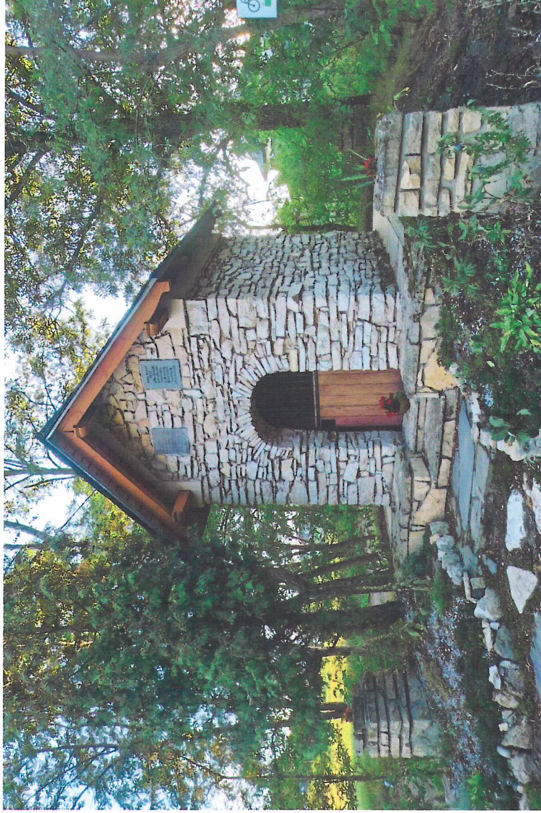
Widok kapliczki od północnego-wschodu

7. Fotografia z opisem wskazującym orientację w stosunku do sąsiednich terenów lub stron świata albo mapa z zaznaczonym stanowiskiem archeologicznym