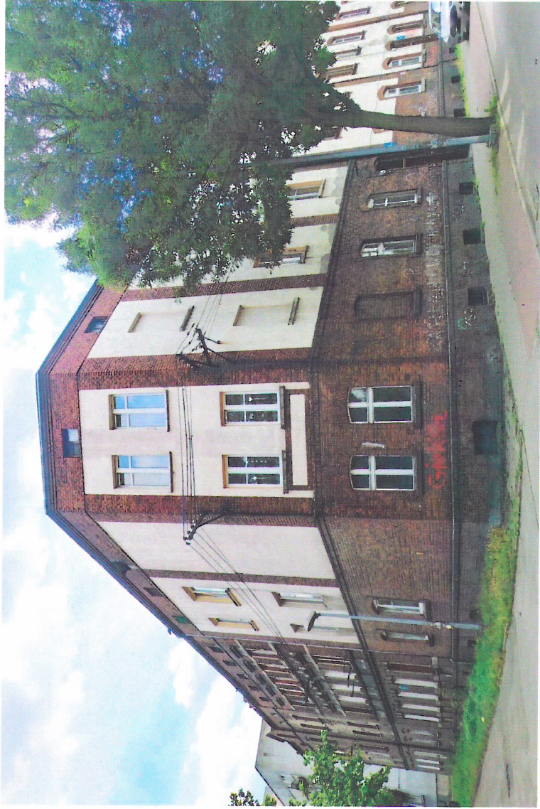
Widok budynku od północy

7. Fotografia z opisem wskazującym orientację w stosunku do sąsiednich terenów lub stron świata albo mapa z zaznaczonym stanowiskiem archeologicznym