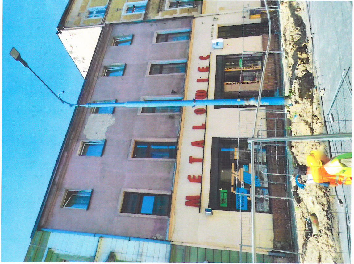
Widok budynku od północnego-wschodu

Miejscowy plan zagospodarowania przestrzennego (Uchwała nr XXVI/424/16 Rady Miasta Mysłówice z dnia 27.10.2016 r.)