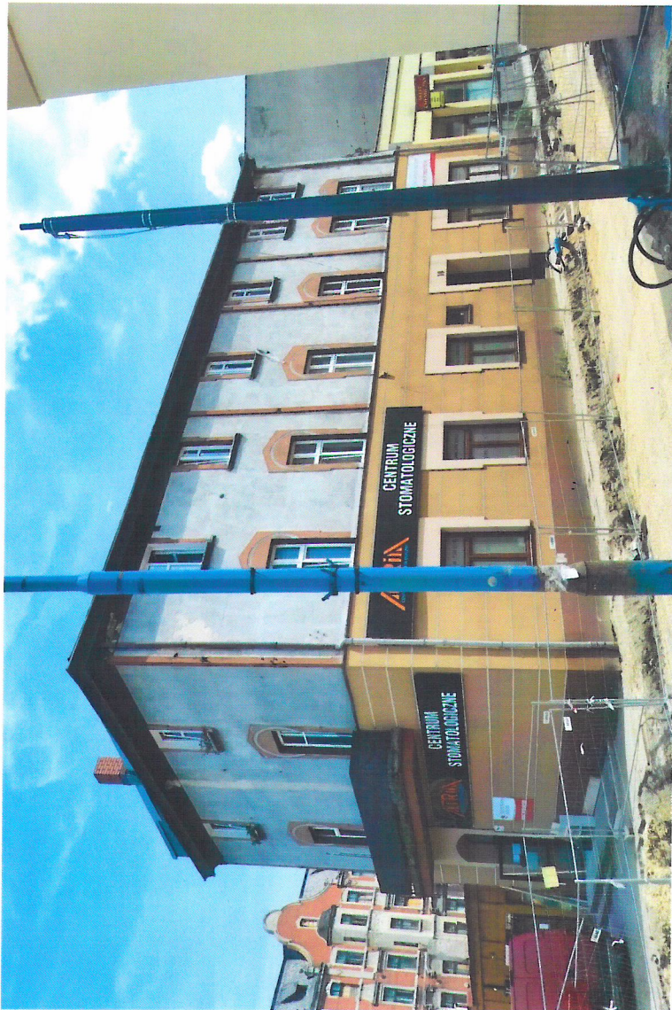
Widok budynku od zachodu

7. Fotografia z opisem wskazującym orientację w stosunku do sąsiednich terenów lub stron świata albo mapa z zaznaczonym stanowiskiem archeologicznym