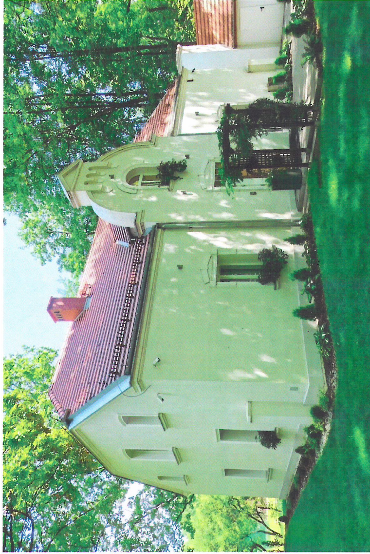
Widok budynku od południowego-wschodu

7. Fotografia z opisem wskazującym orientację w stosunku do sąsiednich terenów lub stron świata albo mapa z zaznaczonym stanowiskiem archeologicznym