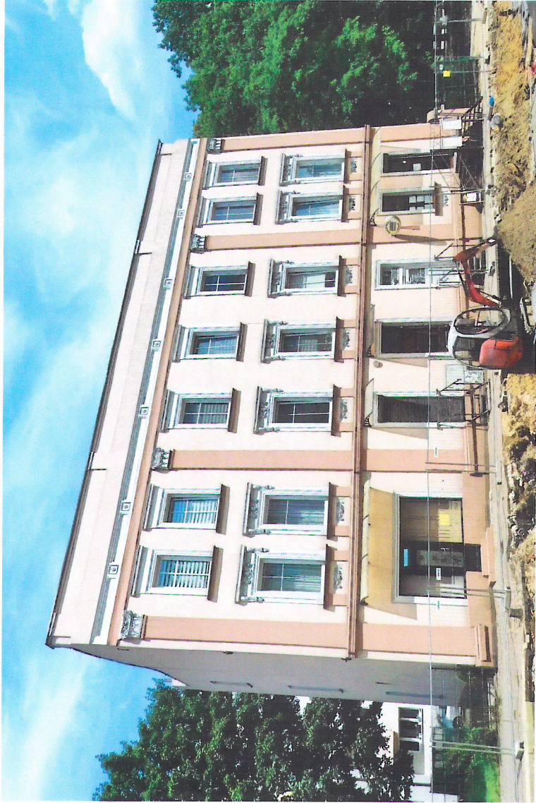
Widok budynku od południowego-zachodu

7. Fotografia z opisem wskazującym orientację w stosunku do sąsiednich terenów lub stron świata albo mapa z zaznaczonym stanowiskiem archeologicznym