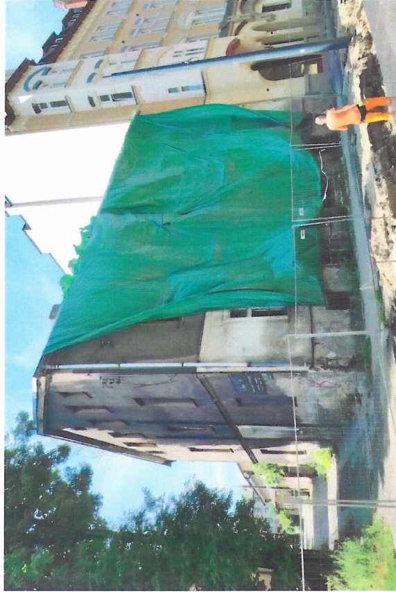
Widok budynku od wschodu

7. Fotografia z opisem wskazującym orientację w stosunku do sąsiednich terenów lub stron świata albo mapa z zaznaczonym stanowiskiem archeologicznym