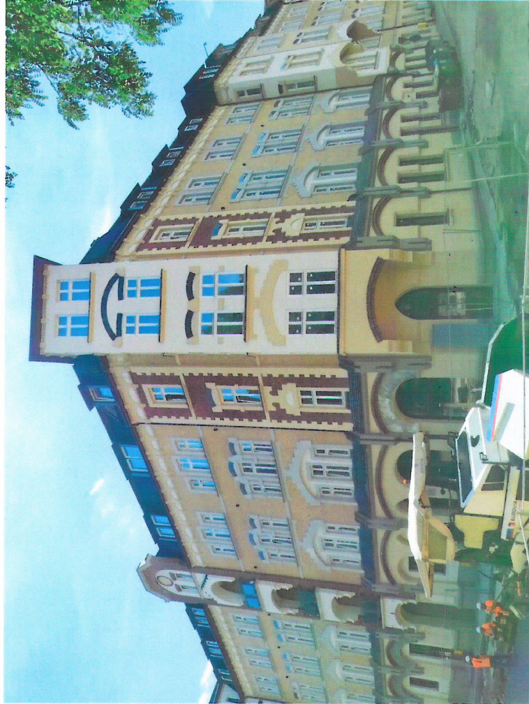
Widok budynku od północy

7. Fotografia z opisem wskazującym orientację w stosunku do sąsiednich terenów lub stron świata albo mapa z zaznaczonym stanowiskiem archeologicznym