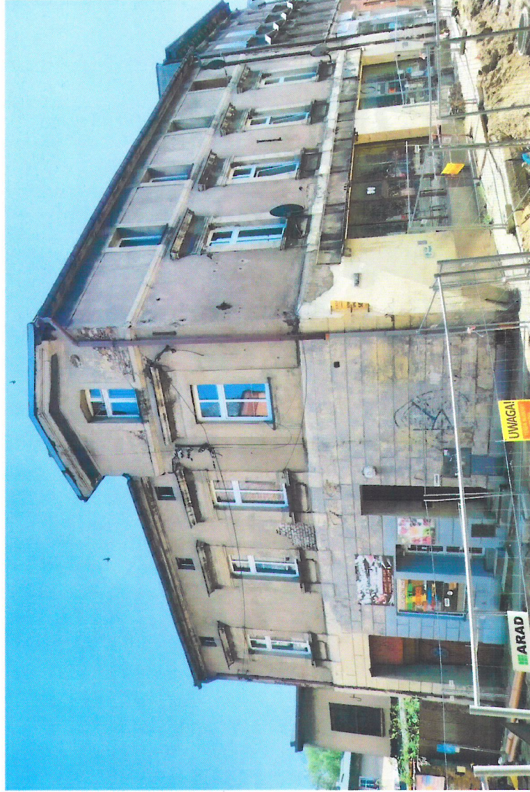
Widok budynku od zachodu

7. Fotografia z opisem wskazującym orientację w stosunku do sąsiednich terenów lub stron świata albo mapa z zaznaczonym stanowiskiem archeologicznym