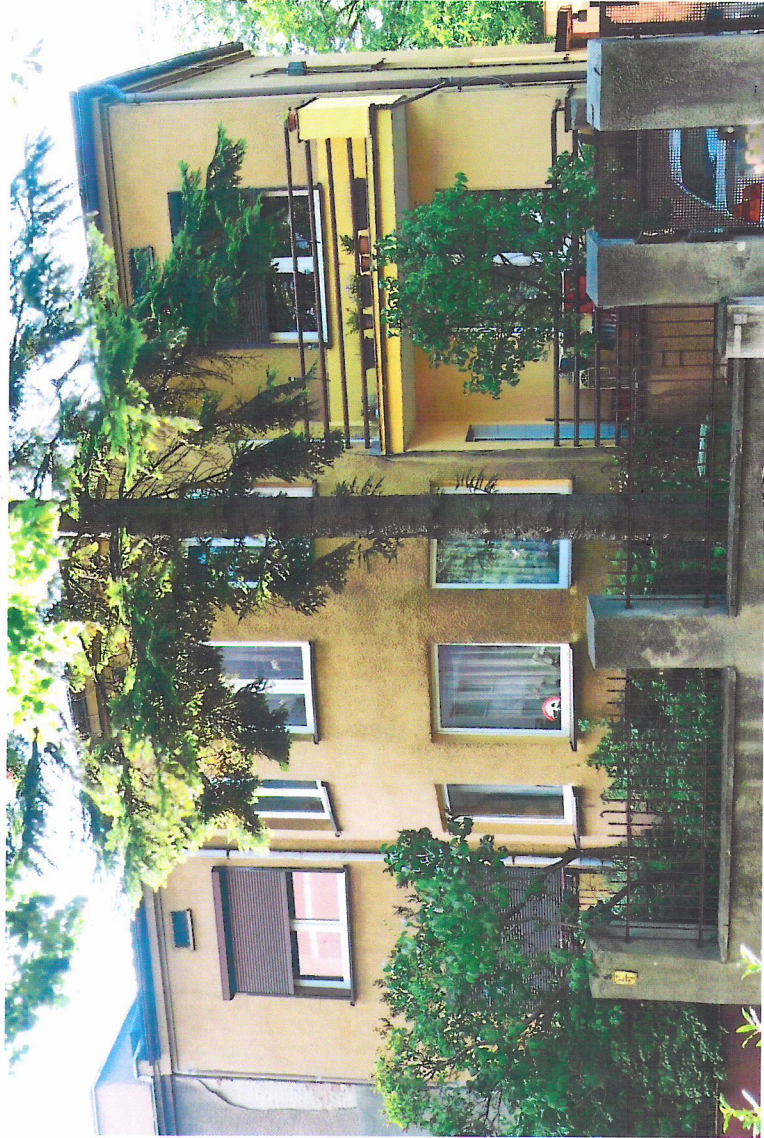
Widok budynku od południowego-wschodu

7. Fotografia z opisem wskazującym orientację w stosunku do sąsiednich terenów lub stron świata albo mapa z zaznaczonym stanowiskiem archeologicznym