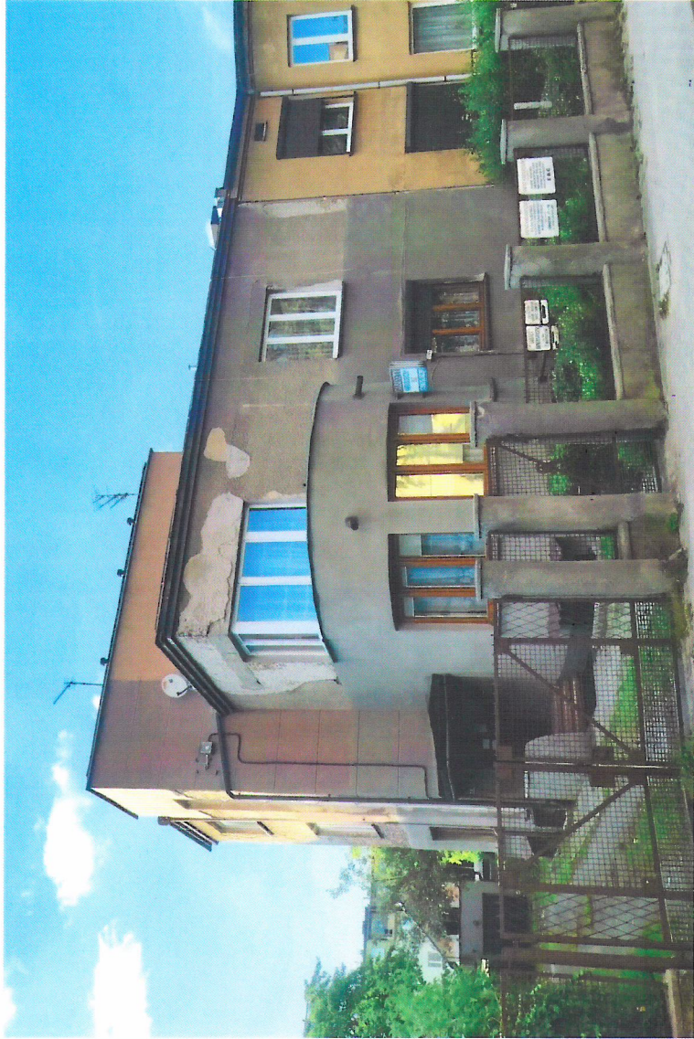
Widok budynku od południowego-wschodu

7. Fotografia z opisem wskazującym orientację w stosunku do sąsiednich terenów lub stron świata albo mapa z zaznaczonym stanowiskiem archeologicznym