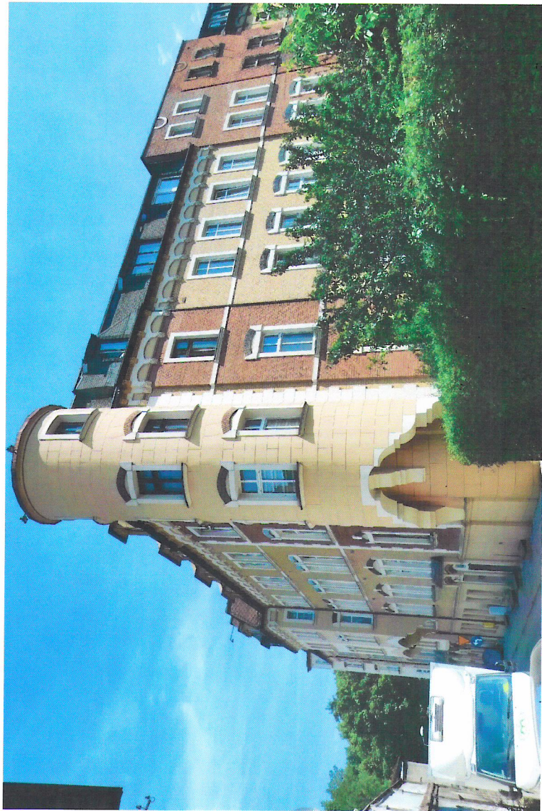
Widok budynku od północnego-zachodu

7. Fotografia z opisem wskazującym orientację w stosunku do sąsiednich terenów lub stron świata albo mapa z zaznaczonym stanowiskiem archeologicznym