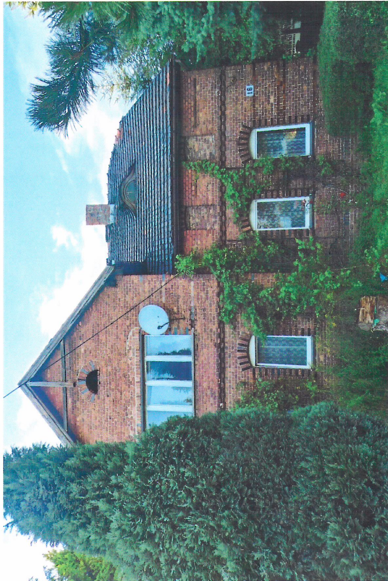
Widok budynku od południowego-wschodu

7. Fotografia z opisem wskazującym orientację w stosunku do sąsiednich terenów lub stron świata albo mapa z zaznaczonym stanowiskiem archeologicznym