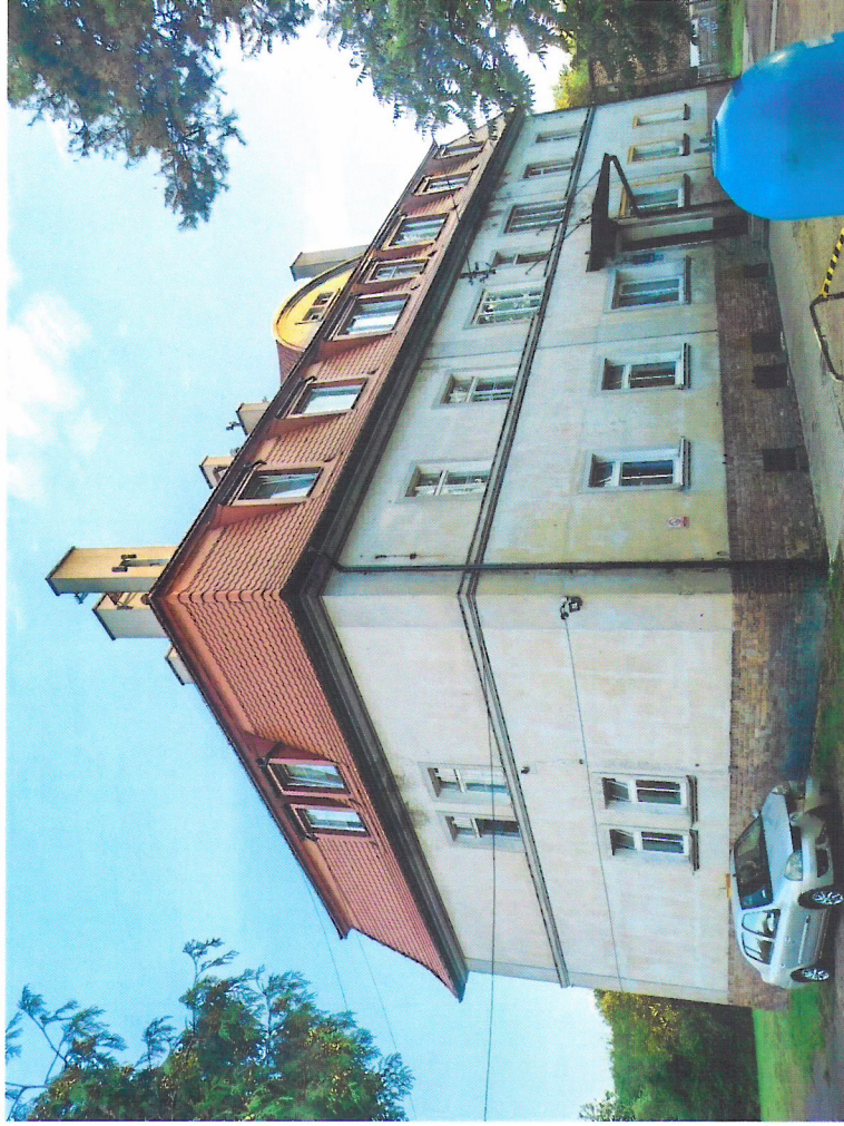
Widok budynku od północnego-wschodu

7. Fotografia z opisem wskazującym orientację w stosunku do sąsiednich terenów lub stron świata albo mapa z zaznaczonym stanowiskiem archeologicznym