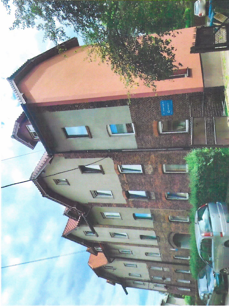
Widok budynku od północno-zachodu

7. Fotografia z opisem wskazującym orientację w stosunku do sąsiednich terenów lub stron świata albo mapa z zaznaczonym stanowiskiem archeologicznym