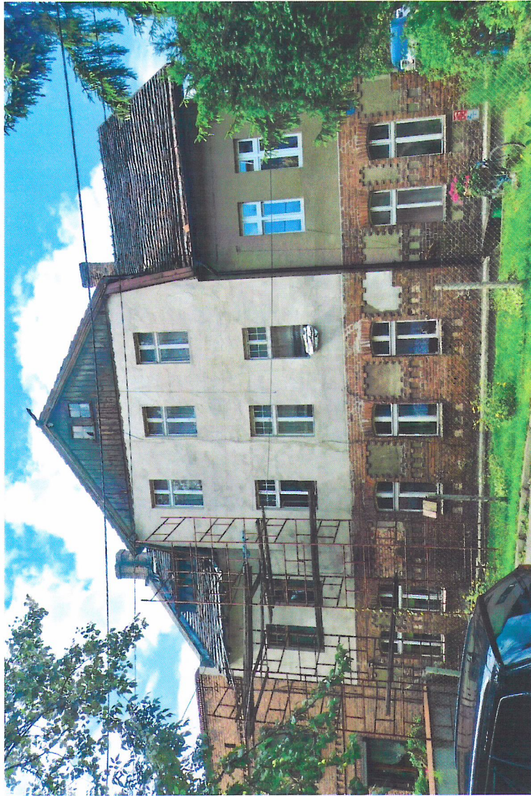
Widok budynku od wschodu

7. Fotografia z opisem wskazującym orientację w stosunku do sąsiednich terenów lub stron świata albo mapa z zaznaczonym stanowiskiem archeologicznym