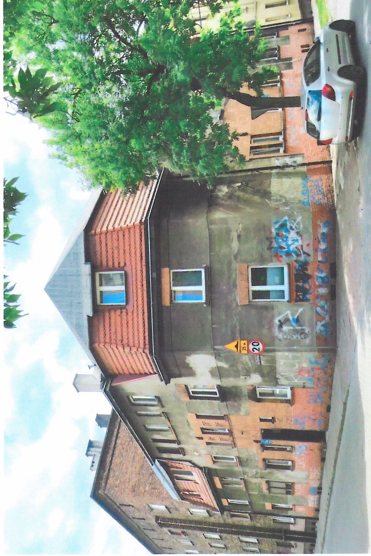
Widok budynku od północnego-zachodu

7. Fotografia z opisem wskazującym orientację w stosunku do sąsiednich terenów lub stron świata albo mapa z zaznaczonym stanowiskiem archeologicznym