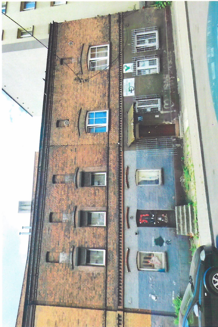
Widok budynku od północy

7. Fotografia z opisem wskazującym orientację w stosunku do sąsiednich terenów lub stron świata albo mapa z zaznaczonym stanowiskiem archeologicznym