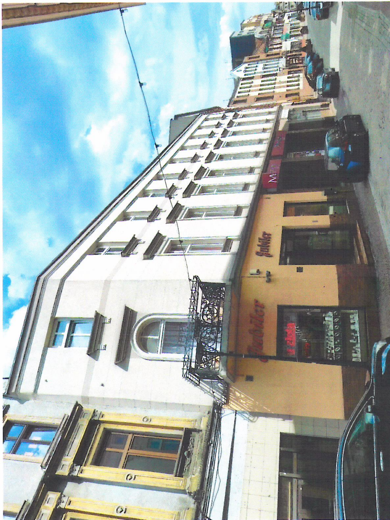
Widok budynku od północnego-zachodu

7. Fotografia z opisem wskazującym orientację w stosunku do sąsiednich terenów lub stron świata albo mapa z zaznaczonym stanowiskiem archeologicznym