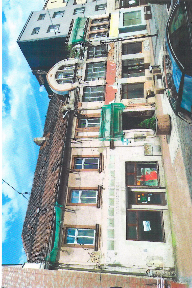
Widok budynku od północnego-zachodu

7. Fotografia z opisem wskazującym orientację w stosunku do sąsiednich terenów lub stron świata albo mapa z zaznaczonym stanowiskiem archeologicznym