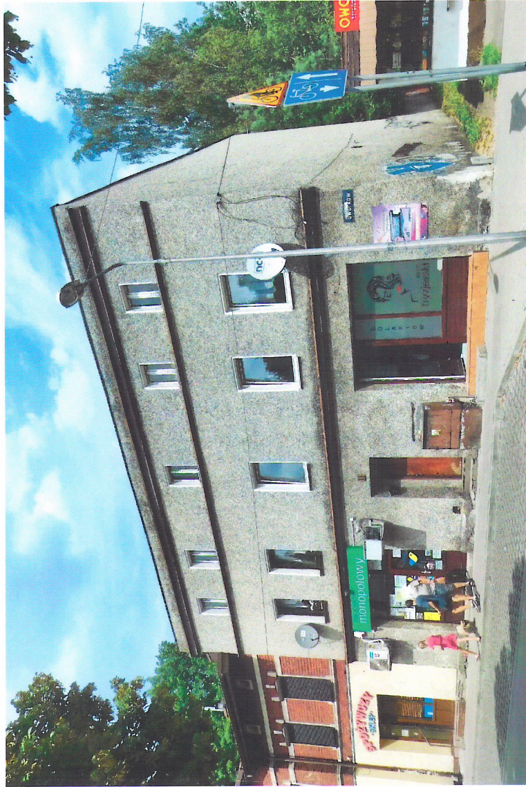
Widok budynku od północnego-wschodu

7. Fotografia z opisem wskazującym orientację w stosunku do sąsiednich terenów lub stron świata albo mapa z zaznaczonym stanowiskiem archeologicznym