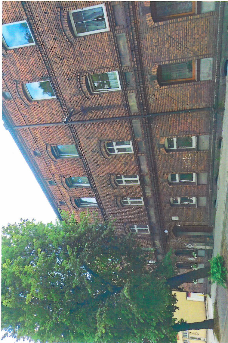
Widok budynku od północnego-wschodu

7. Fotografia z opisem wskazującym orientację w stosunku do sąsiednich terenów lub stron świata albo mapa z zaznaczonym stanowiskiem archeologicznym