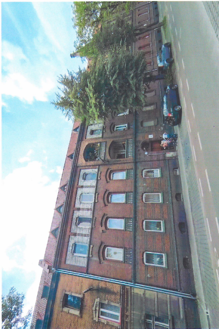
Widok budynku od północnego-wschodu

7. Fotografia z opisem wskazującym orientację w stosunku do sąsiednich terenów lub stron świata albo mapa z zaznaczonym stanowiskiem archeologicznym