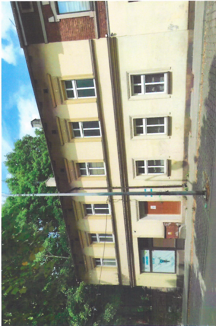
Widok budynku od północnego-zachodu

7. Fotografia z opisem wskazującym orientację w stosunku do sąsiednich terenów lub stron świata albo mapa z zaznaczonym stanowiskiem archeologicznym