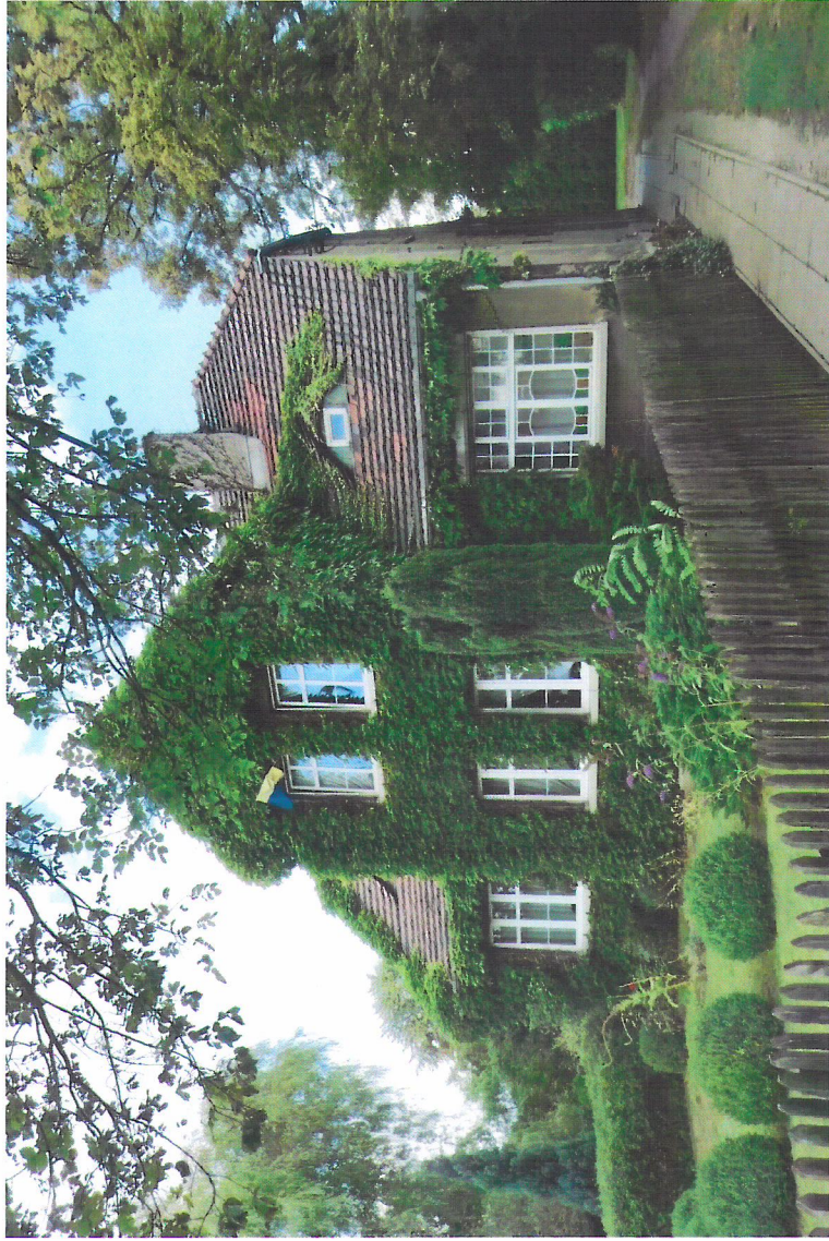
Widok budynku od południowego-wschodu

7. Fotografia z opisem wskazującym orientację w stosunku do sąsiednich terenów lub stron świata albo mapa z zaznaczonym stanowiskiem archeologicznym