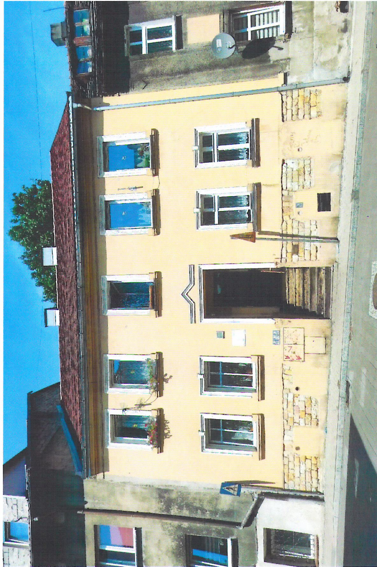
Widok budynku od południowego-wschodu

7. Fotografia z opisem wskazującym orientację w stosunku do sąsiednich terenów lub stron świata albo mapa z zaznaczonym stanowiskiem archeologicznym