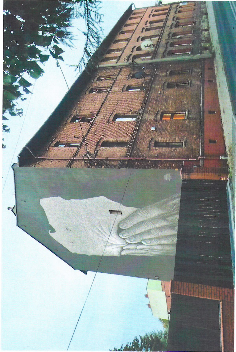
Widok budynku od północnego-zachodu

7. Fotografia z opisem wskazującym orientację w stosunku do sąsiednich terenów lub stron świata albo mapa z zaznaczonym stanowiskiem archeologicznym