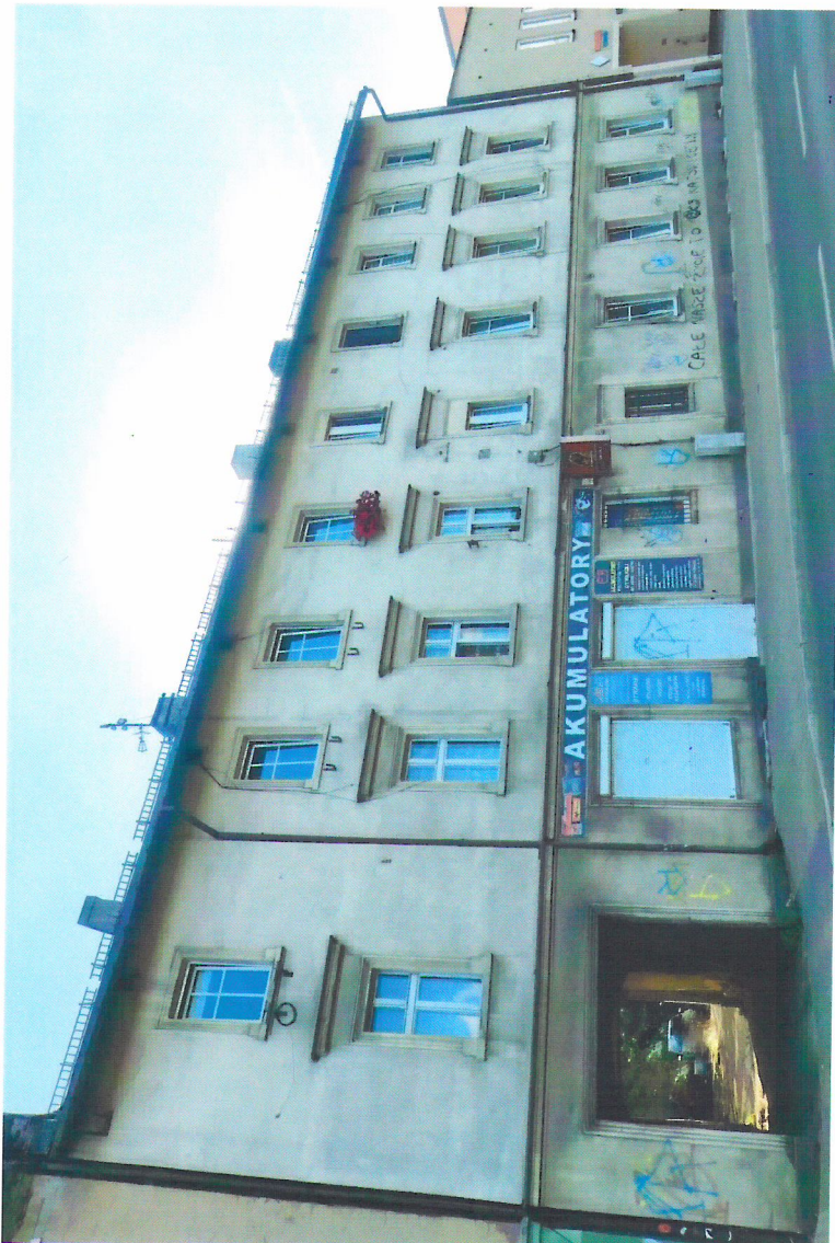
Widok budynku od północnego-wschodu

7. Fotografia z opisem wskazującym orientację w stosunku do sąsiednich terenów lub stron świata albo mapa z zaznaczonym stanowiskiem archeologicznym