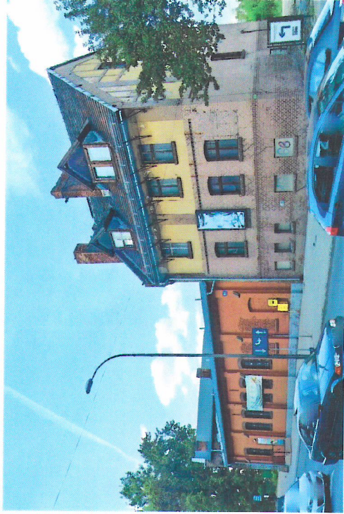
Widok budynku od południa

7. Fotografia z opisem wskazującym orientację w stosunku do sąsiednich terenów lub stron świata albo mapa z zaznaczonym stanowiskiem archeologicznym