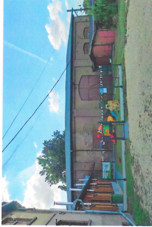
Widok budynku od południowego-wschodu