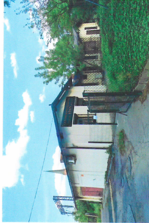
Widok budynku od południowego-zachodu