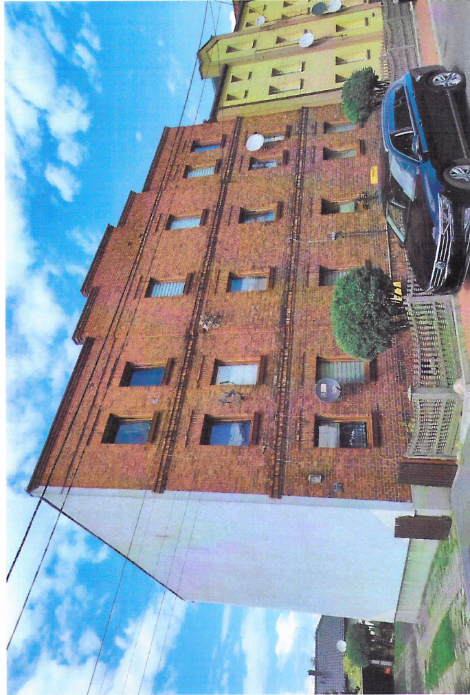
Widok budynku od południowego-zachodu

7. Fotografia z opisem wskazującym orientację w stosunku do sąsiednich terenów lub stron świata albo mapa z zaznaczonym stanowiskiem archeologicznym