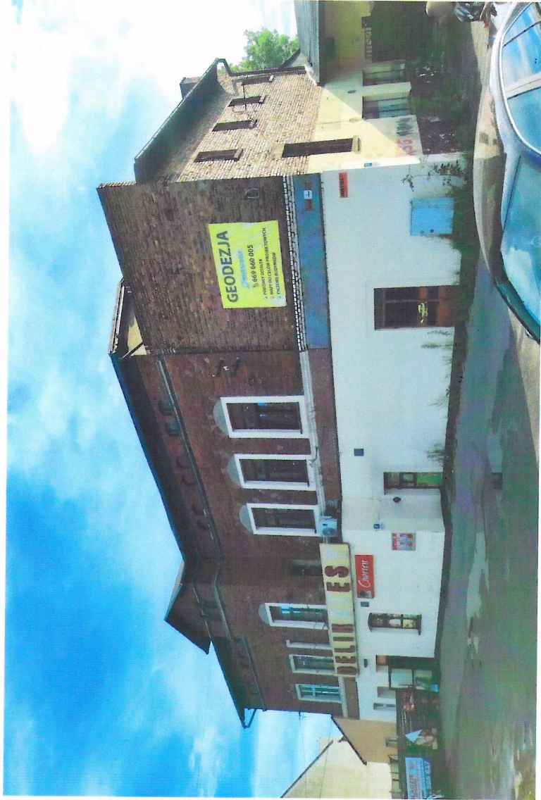
Widok budynku od północnego-wschodu

7. Fotografia z opisem wskazującym orientację w stosunku do sąsiednich terenów lub stron świata albo mapa z zaznaczonym stanowiskiem archeologicznym