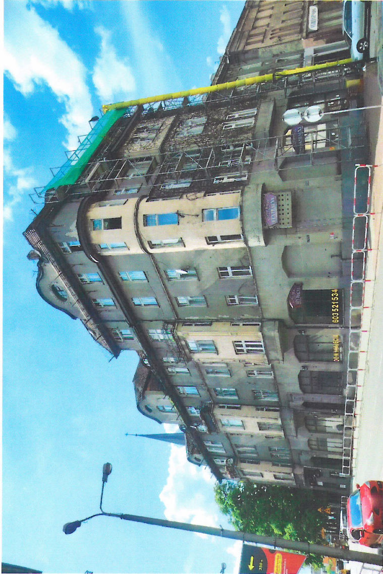
Widok budynku od południowego-wschodu

7. Fotografia z opisem wskazującym orientację w stosunku do sąsiednich terenów lub stron świata albo mapa z zaznaczonym stanowiskiem archeologicznym