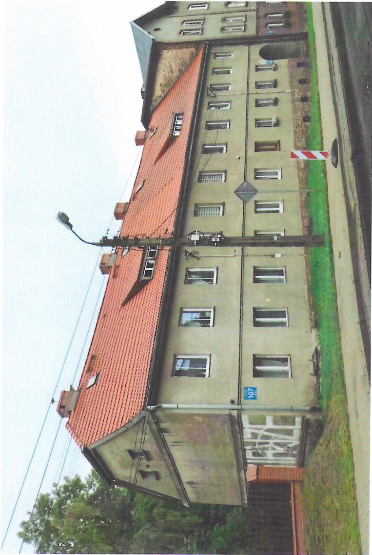
Widok budynku od północnego-wschodu

7. Fotografia z opisem wskazującym orientację w stosunku do sąsiednich terenów lub stron świata albo mapa z zaznaczonym stanowiskiem archeologicznym