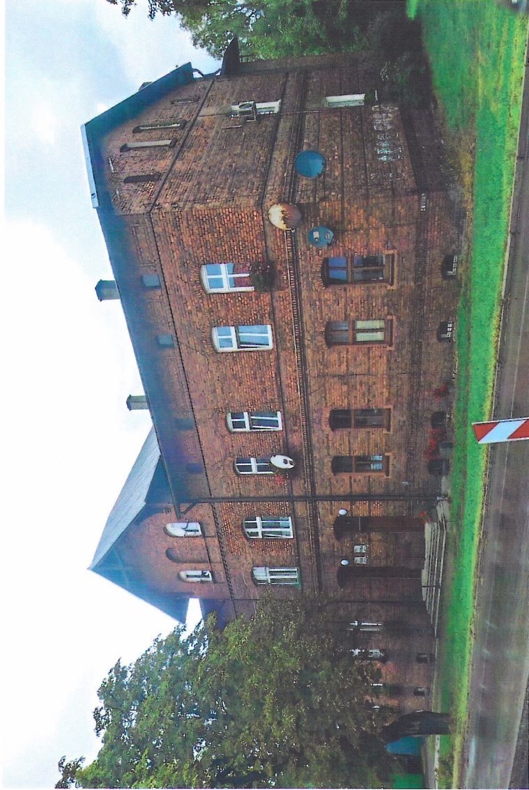
Widok budynku od południowego-wschodu

7. Fotografia z opisem wskazującym orientację w stosunku do sąsiednich terenów lub stron świata albo mapa z zaznaczonym stanowiskiem archeologicznym