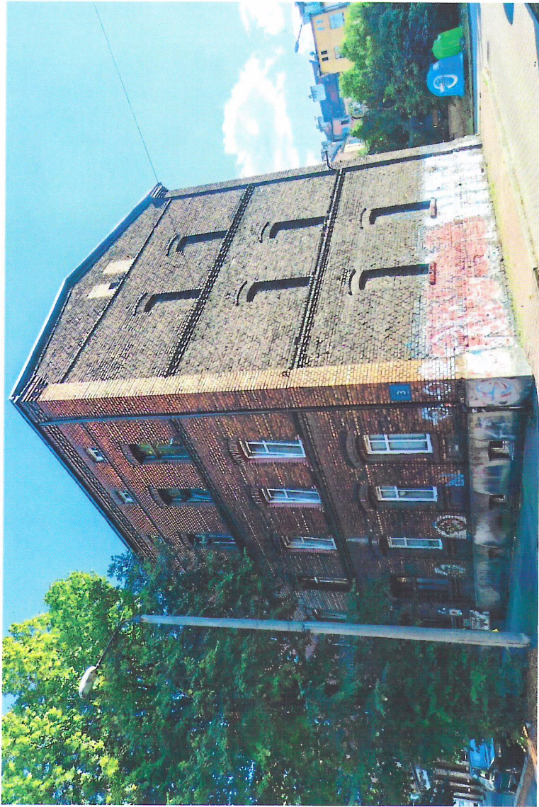
Widok budynku od północnego-wschodu

7. Fotografia z opisem wskazującym orientację w stosunku do sąsiednich terenów lub stron świata albo mapa z zaznaczonym stanowiskiem archeologicznym