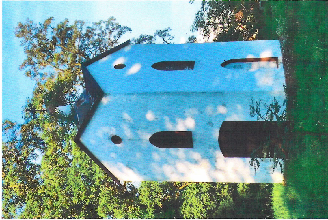
Widok od zachodu

7. Fotografia z opisem wskazującym orientację w stosunku do sąsiednich terenów lub stron świata albo mapa z zaznaczonym stanowiskiem archeologicznym