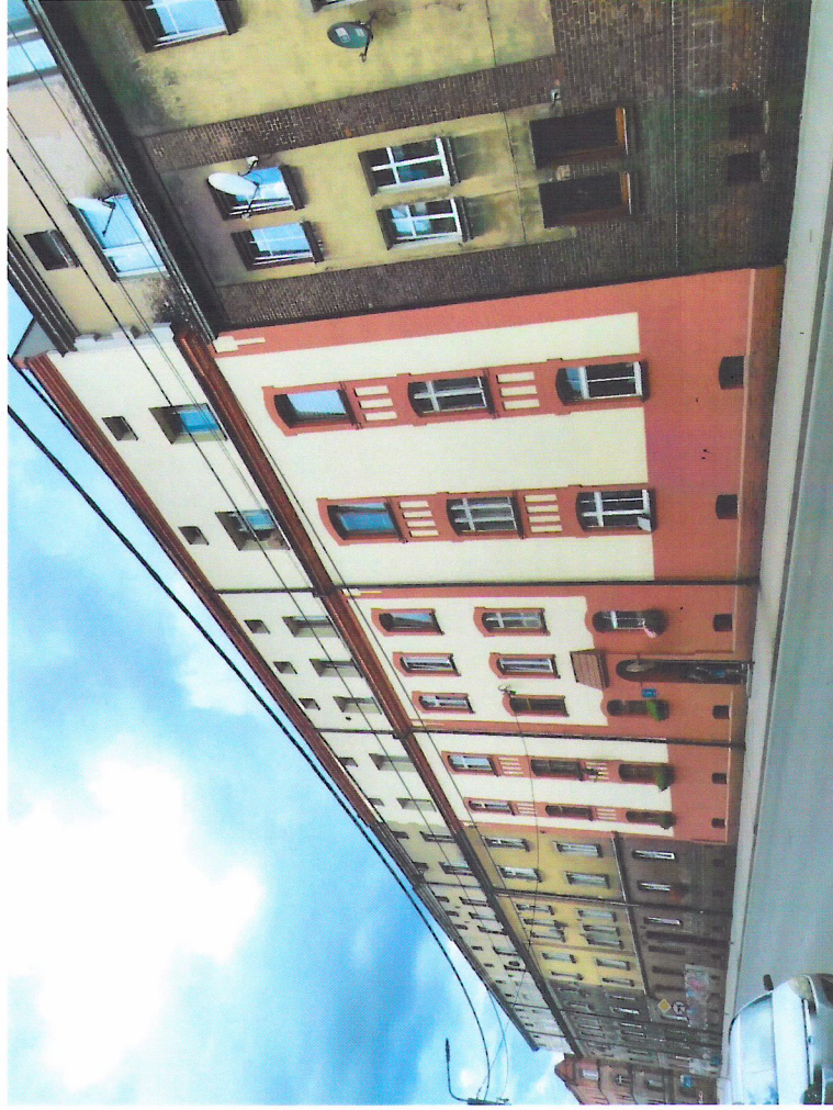
Widok budynku od południowego-wschodu

7. Fotografia z opisem wskazującym orientację w stosunku do sąsiednich terenów lub stron świata albo mapa z zaznaczonym stanowiskiem archeologicznym