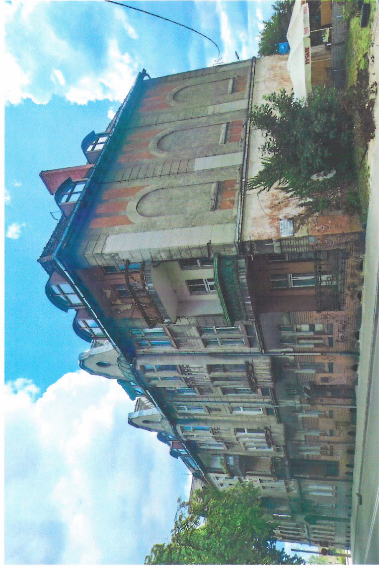
Widok budynku od północnego-zachodu

7. Fotografia z opisem wskazującym orientację w stosunku do sąsiednich terenów lub stron świata albo mapa z zaznaczonym stanowiskiem archeologicznym