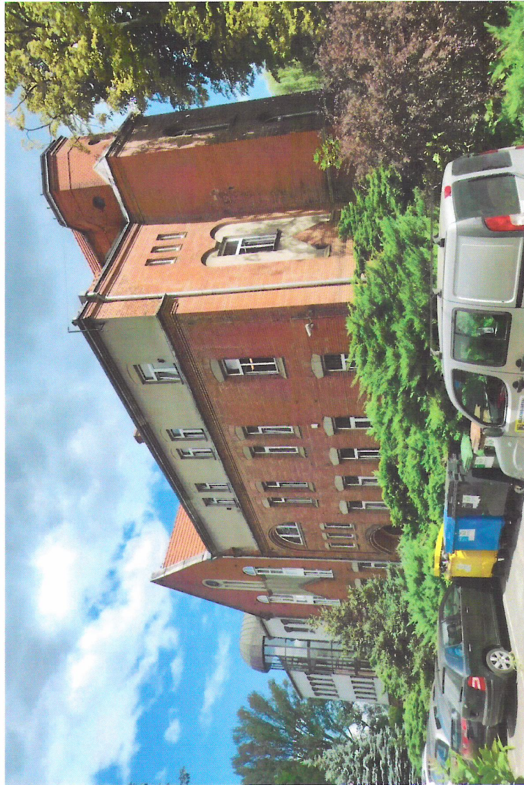
Widok budynku od południowego-zachodu

7. Fotografia z opisem wskazującym orientację w stosunku do sąsiednich terenów lub stron świata albo mapa z zaznaczonym stanowiskiem archeologicznym