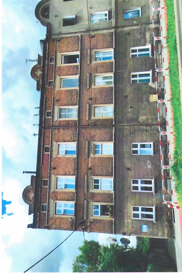
Widok budynku od północno-wschodu

7. Fotografia z opisem wskazującym orientację w stosunku do sąsiednich terenów lub stron świata albo mapa z zaznaczonym stanowiskiem archeologicznym