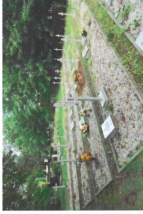
Widok od południowego-wschodu