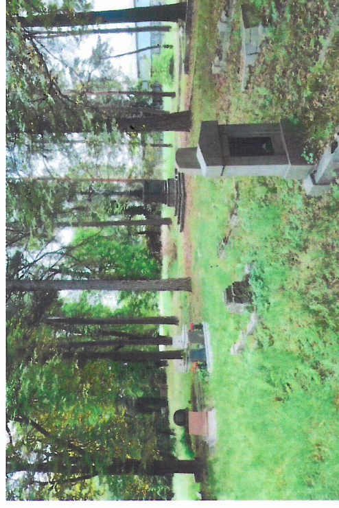
Widok od północnego-zachodu