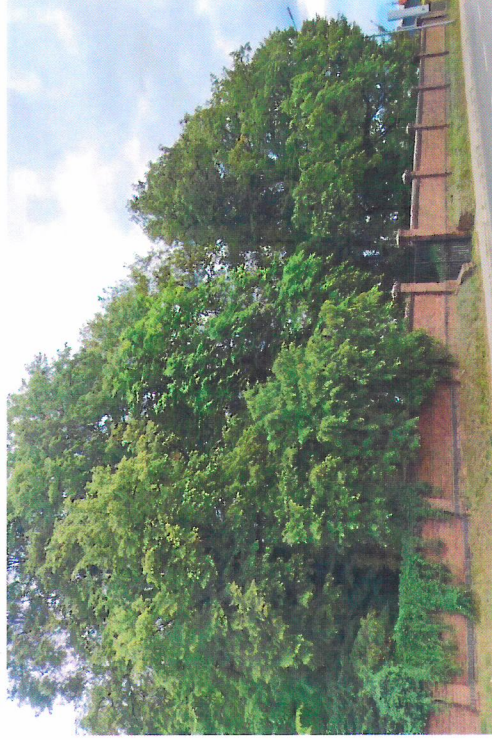
Widok od północnego-zachodu

7. Fotografia z opisem wskazującym orientację w stosunku do sąsiednich terenów lub stron świata albo mapa z zaznaczonym stanowiskiem archeologicznym