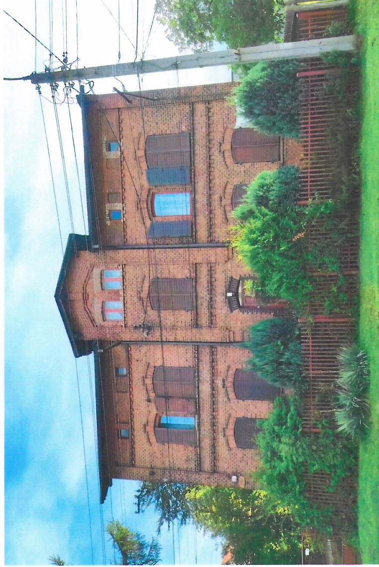
Widok budynku od północnego-wschodu

7. Fotografia z opisem wskazującym orientację w stosunku do sąsiednich terenów lub stron świata albo mapa z zaznaczonym stanowiskiem archeologicznym