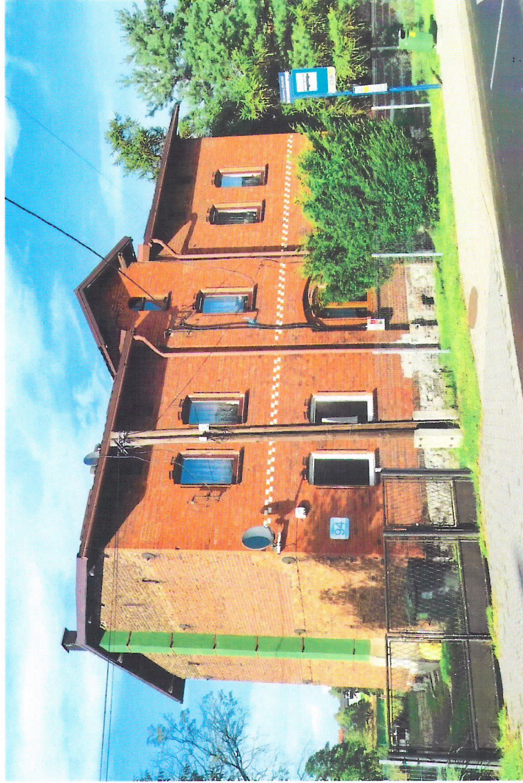
Widok budynku od południowego-zachodu

7. Fotografia z opisem wskazującym orientację w stosunku do sąsiednich terenów lub stron świata albo mapa z zaznaczonym stanowiskiem archeologicznym