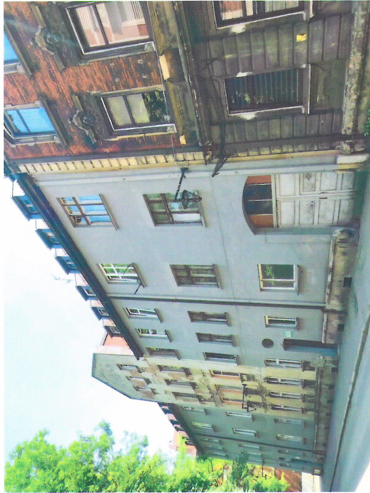
Widok budynku od południowego-zachodu

7. Fotografia z opisem wskazującym orientację w stosunku do sąsiednich terenów lub stron świata albo mapa z zaznaczonym stanowiskiem archeologicznym