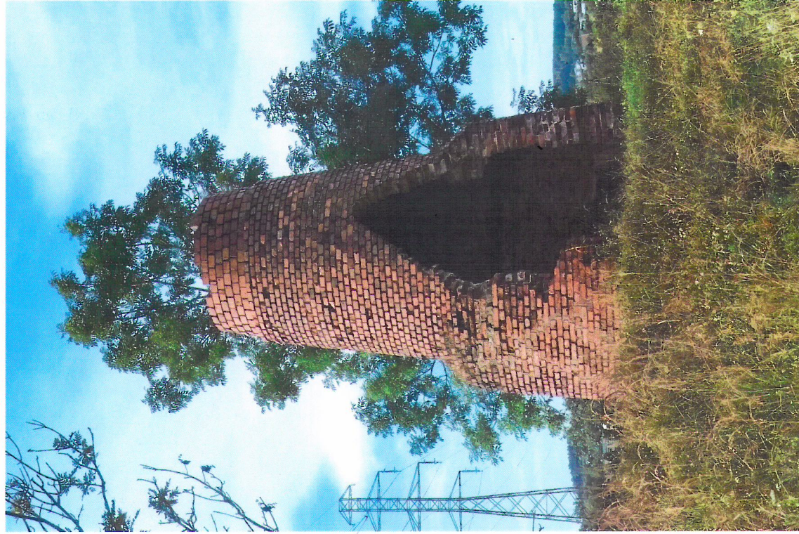
Widok od południa

7. Fotografia z opisem wskazującym orientację w stosunku do sąsiednich terenów lub stron świata albo mapa z zaznaczonym stanowiskiem archeologicznym