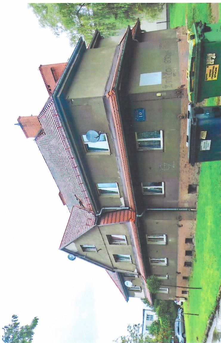
Widok budynku od południowego-wschodu

7. Fotografia z opisem wskazującym orientację w stosunku do sąsiednich terenów lub stron świata albo mapa z zaznaczonym stanowiskiem archeologicznym